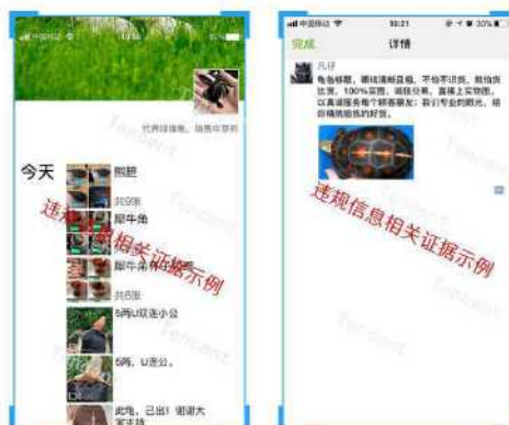
图 A.2 用户上传证据截图示例